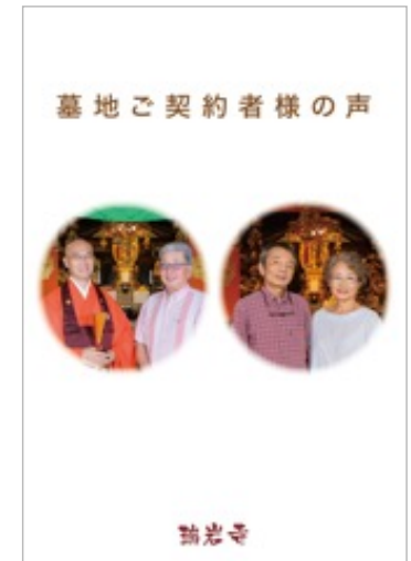
パンフレット作成