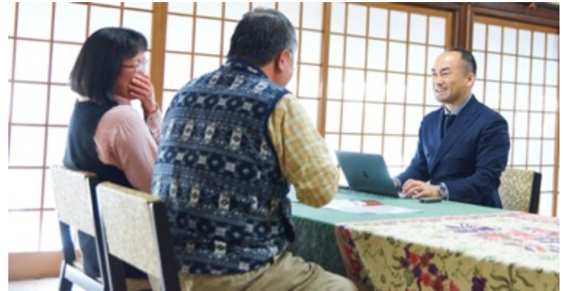
施主様に墓を使った感想をインタビュー