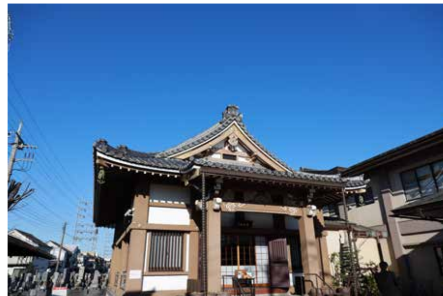
上／奥様のご実家の墓がある寺院で法話会をしているケネス教授 下／お墓がある寺院はケネス教授の自宅近くにあり、よく墓参りに来ているそうだ